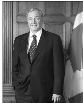
پال مارتین، نخست وزیر کانادا